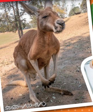
カンガルー/イメージ/◇