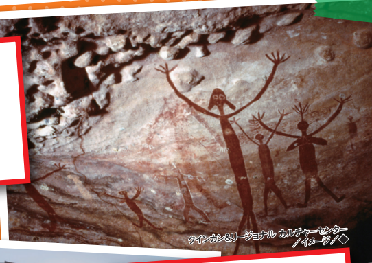
クインズランド・シムナル カルチャーセンター/イメージ/◇