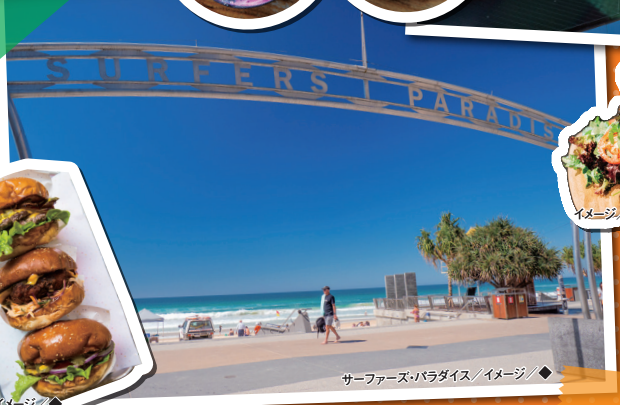
サーファーズパラダイス/イメージ/◇